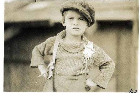
Le Kid